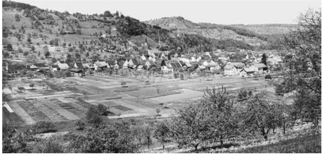
Bubendorf 1915. Vor fast 100 Jahren hatte die Gemeinde noch rund 1400 Einwohner. Seither haben Bevölkerungszahl und Zersiedelung kontinuierlich und exemplarisch zugenommen.

Damit aber hinkt Basel auch weiterhin hinter den Metropolitanregionen Zürich und Genf her. Bei der Zunahme der Wohnbevölkerung lagen diese zwischen 2000 und 2010 fast 50 Prozent