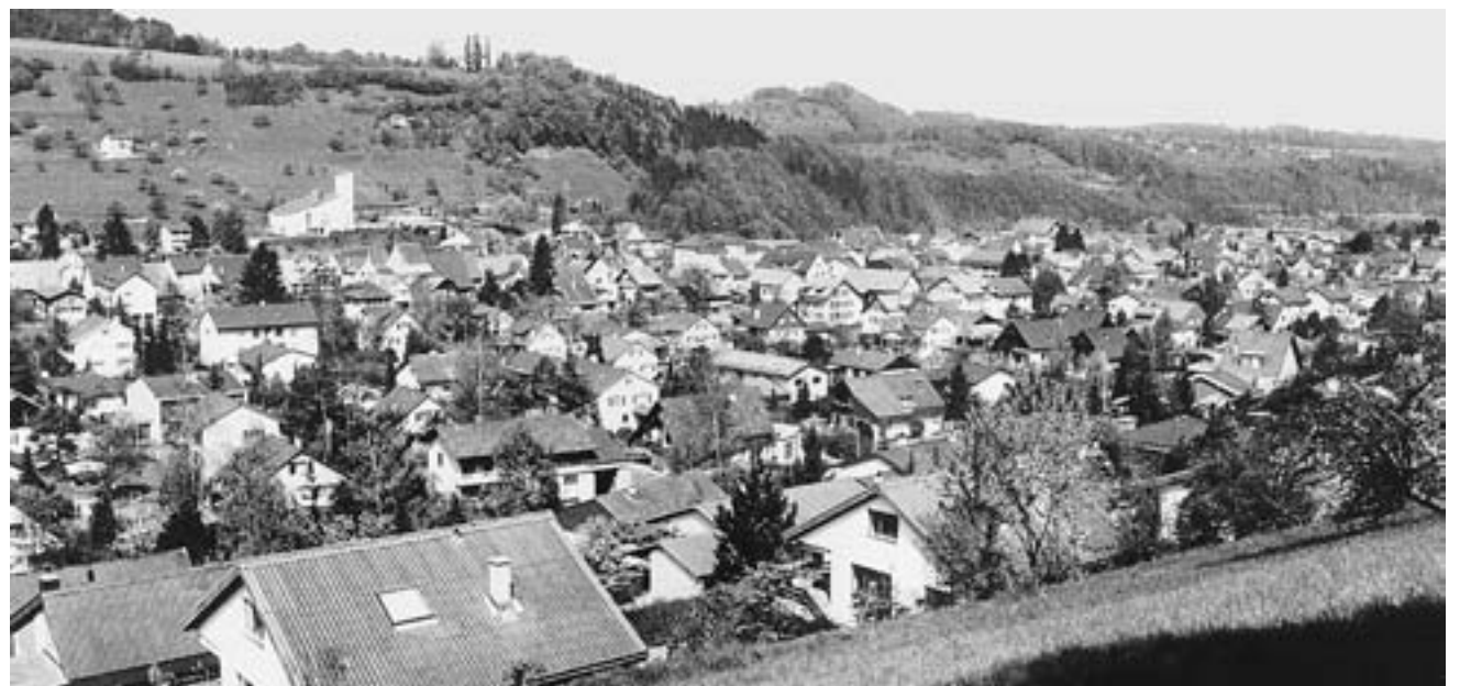
Bubendorf 1989. Bis Ende des letzten Jahrhunderts ist die Gemeinde auf über 3200 Einwohner angewachsen. Heute sind es 4379. Die Bilder stammen aus dem Buch «Augenblicke», das im Baselieter Kantonsverlag erschienen ist.

über dem Landesdurchschnitt. Davon ist Basel weit entfernt. Doch auch der Stadtkanton wächst wieder. «Eine allgemeine Renaissance der Städte führt wieder zur Zuwanderung», erklärt Müller-Jentsch. «Hinzu kommt eine allgemeine Bevölkerungszunahme durch Zuwanderung.» Das seien alles keine regionalspezifischen Phänomene. Die Stadt Basel allerdings habe es geschafft, sich aufgrund ihrer Wirtschaftsstruktur trotz Krisen konjunkturell erfolgreich zu entwickeln, Stellen zu schaffen und so neue Einwohner anzulocken. «Der grosse Suburbanisierungsschub ist mittlerweile durch», kommentiert Müller-Jentsch.